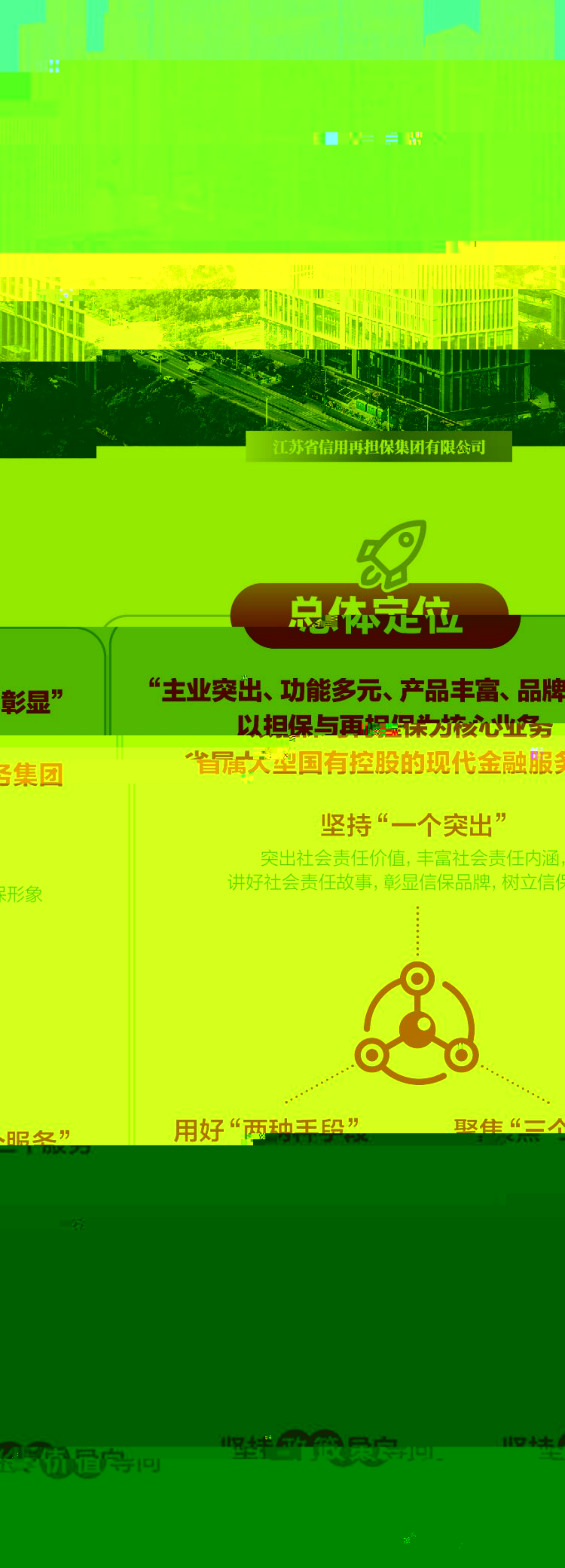
江苏省信用再担保集团有限公司